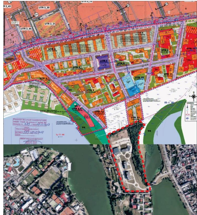
P.U.Z. Șos Fabrica de Glucoză nr 6-8 aprobat aprobat prin HCGMB nr 87/28.04.2011, în prezent expirat