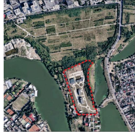
P.U.Z. Sector 2 aprobat prin HCL nr 99/2003 prelungit cu HCL nr 5/ 2013, în prezent expirat

Conform P.U.Z. Șos Fabrica de Glucoză nr 6-8 aprobat prin HCGMB nr 87/28.04.2011 , în prezent expirat, terenul are acces reglementat dinspre Șos Fabrica de Glucoză